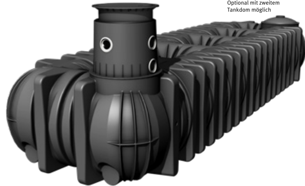
Optional mit zweitem Tankdom möglich