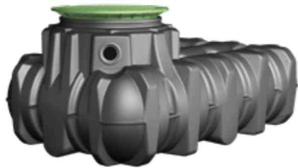
Abbildung zeigt 1.500 l Tank mit Teleskop-Domschacht 600 Mini, begehbar