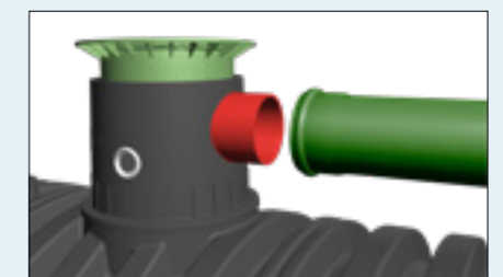
Größere Anschlussstutzen auf Anfrage